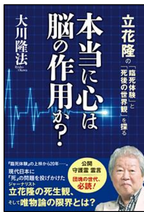
『本当に心は脳の作用か?』